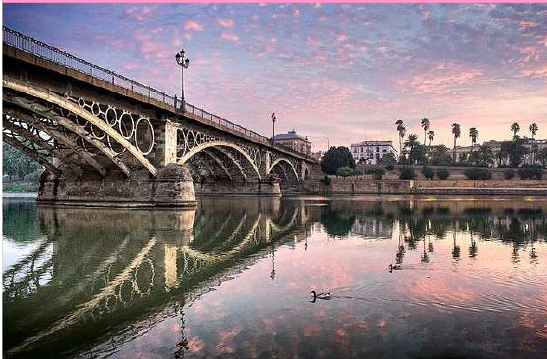
Pont de Triana