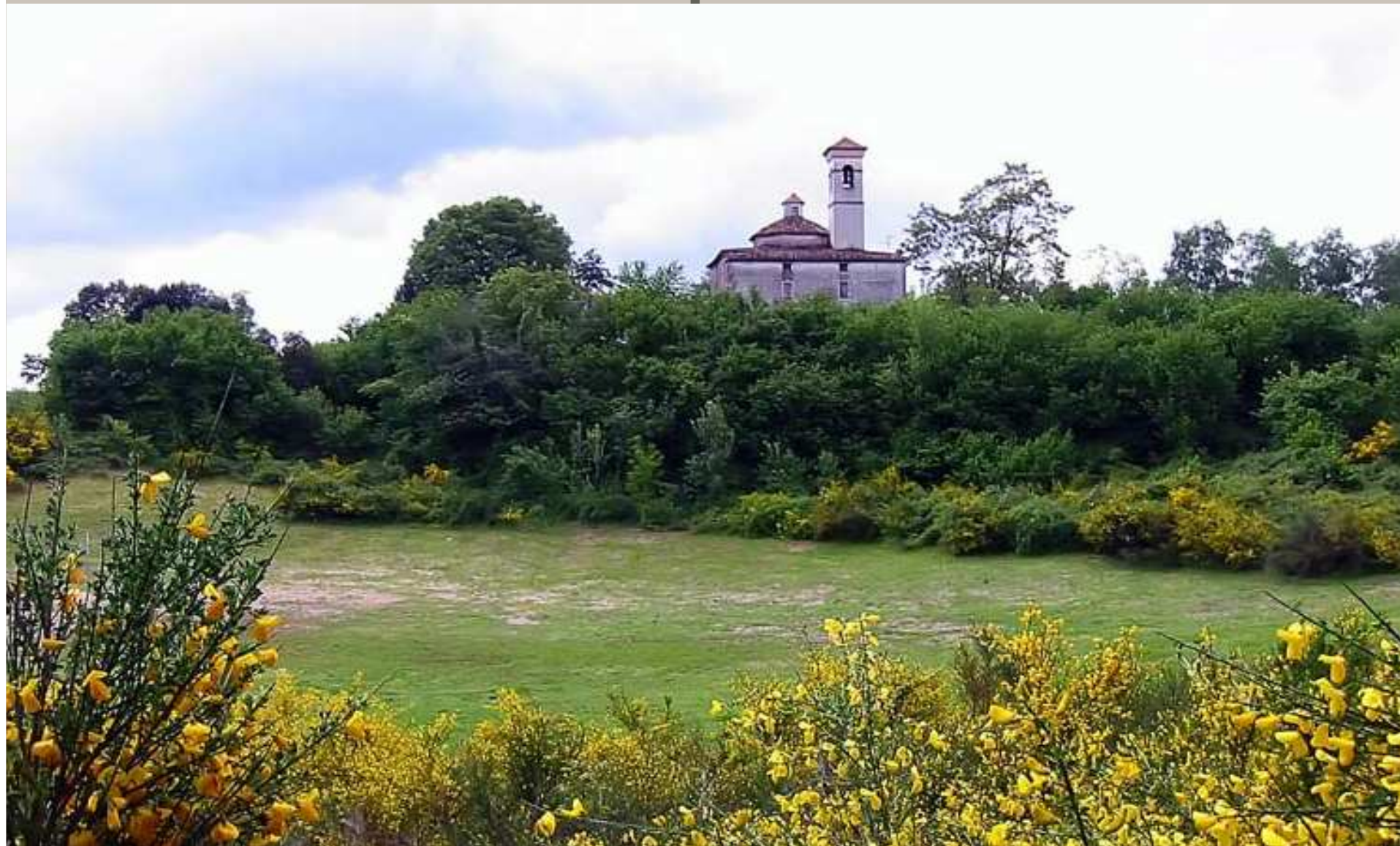
Volcà de Sant Francesc