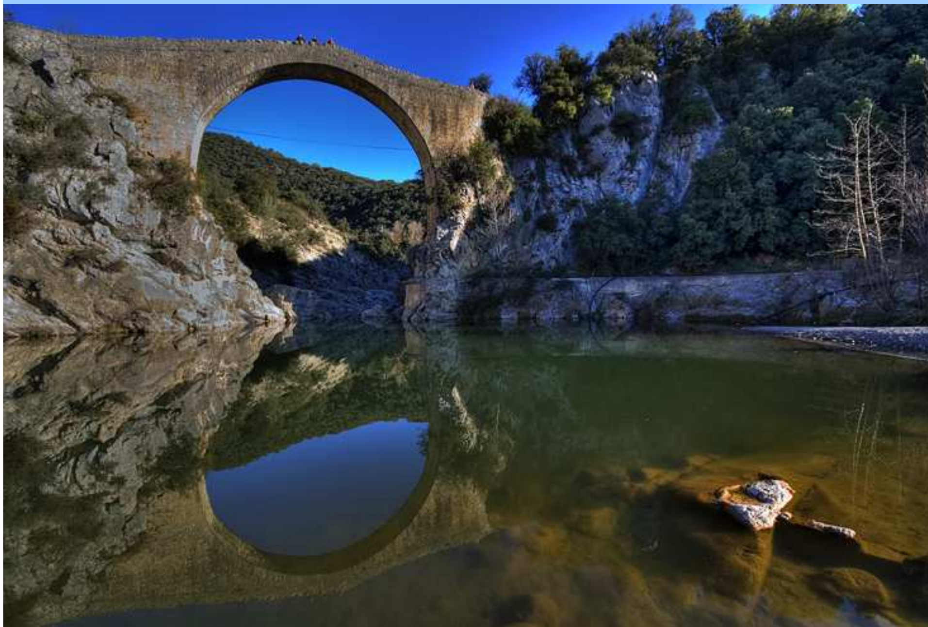
El Pont de Llerca