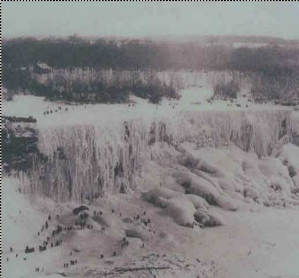
Cataratas del Niagara heladas. 1911

Bellaterra, 6 marzo de 2010 http://www.joanteixido.org