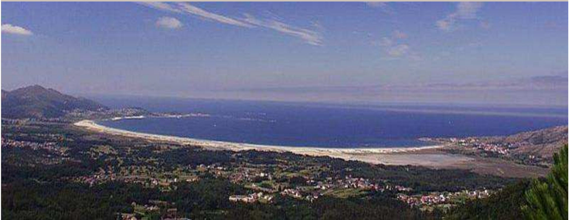
Platja de Carnota