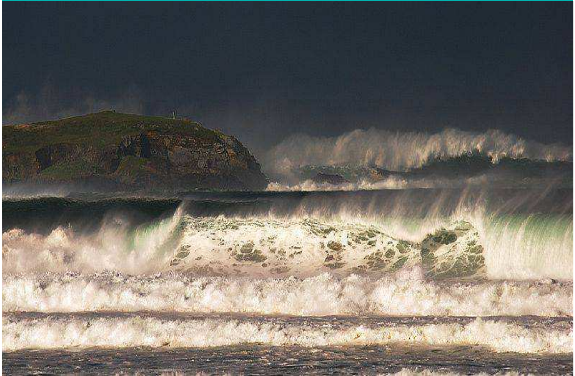
Tsunami a la punta Frouxeira, Valdoviño