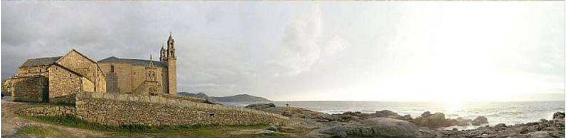
Santuari de la Verge de la Barca, Muxia